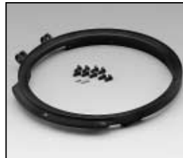
L4.83367.E Front casting Frontteil