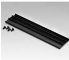
L4.83370.E Set of 3 extrusions, top Set mit 3 Rippenblechen, oben