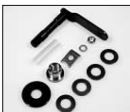
L4.80545.E Lamp lock shaft Hebel geschweißt