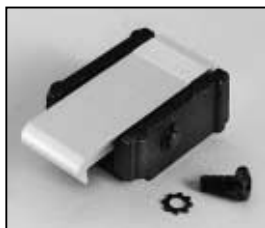
L4.79747.E Door catch set Schnapphaken-Set