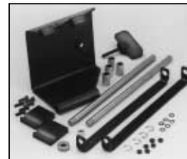
L4.83208.E Justable stirrup bracket set left f. motorized stirrup Schwerpunktverstellung links für motorisierte Bügel