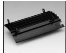
L4.83369.E Side extrusion left Rippenblech links