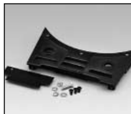
L4.83371.E Base casting Wannenstirnteil