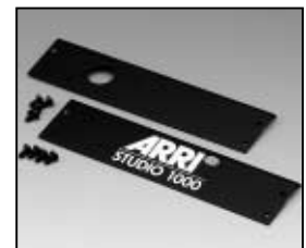
L4.83373.E Internal side baffle left + right Mantelstromblech links + rechts