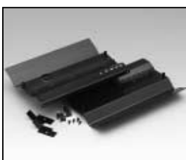
L4.83374.E Internal side baffle left + right Mantelstromblech links + rechts