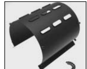
L4.74544.E Internal side baffle Mantelstromblech