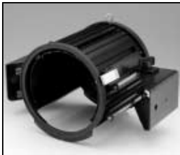
L4.83365.E Housing compl. Gehäuse kpl.

NOTE: WHEN ORDERING QUOTE PART NUMBER BEMERKUNG: BEI BESTELLUNG IDENT.-NR. ANGEBEN