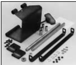
L4.83199.E Justable stirrup bracket set right Schwerpunktverstellung rechts