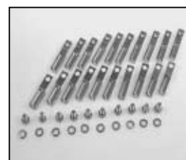
L4.80540.E Set of 10 pcs. lamp holder contacts Set 10 St. Lampenklemmstücke