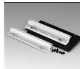
L4.83372.E Bottom panel Bodenblech