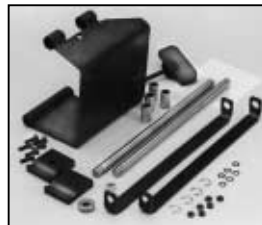
L4.83207.E Justable stirrup bracket set right f. motorized stirrup Schwerpunktverstellung rechts für motorisierte Bügel