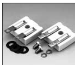
L4.83123.E Lamp holder compl. Lampenfassung kpl.