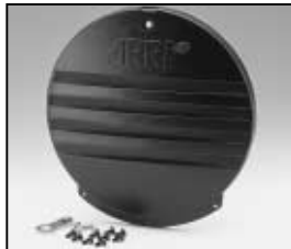
L4.83366.E Rear casting Rückteil