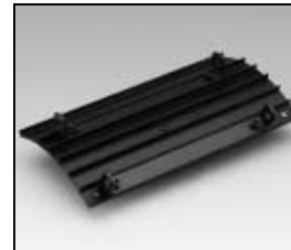
L4.83368.E Side extrusion right Rippenblech rechts