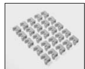
L4.80413.E 25 pcs. ceramic holder-reflector 25 St. Keramikhalter-Reflektor